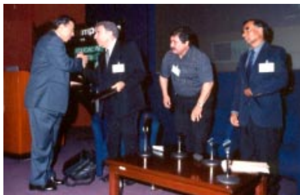
Participantes del panel de Vinculación Escuela-Industria.