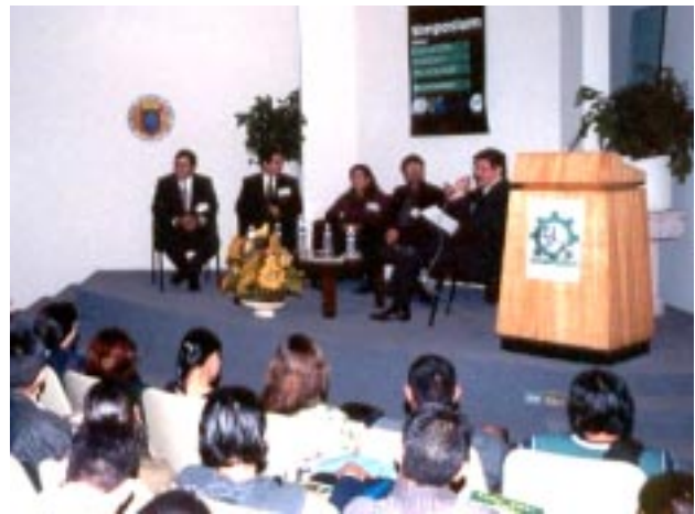
Panel «Por qué obtener un doctorado» realizado en el auditorio Dr. Raúl G. Quintero Flores.

Otro panel que se llevó a cabo fue el “Por qué obtener un doctorado” participando destacados Doctores, algunos egresados de la propia Facultad, cuyo objetivo fue interesar e invitar a los alumnos a seguir preparándose para contribuir en una forma más destacada en el desarrollo del País.