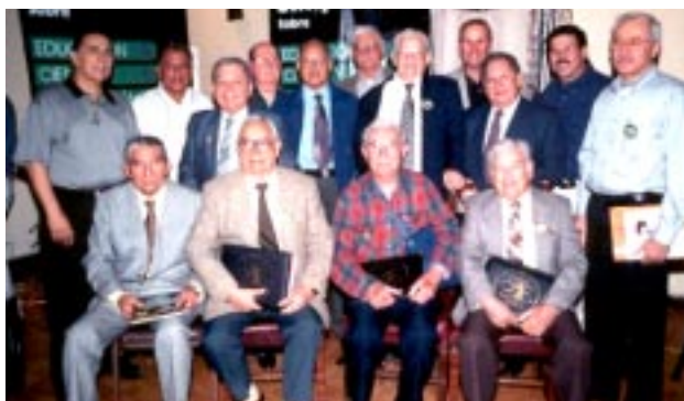
Reconocimiento a ex-alumnos de la primera generación de egresados de nuestra facultad.

El día 22 se inició un Simposium sobre Educación, Ciencia y Tecnología, siendo sede la Biblioteca Uni-