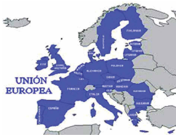
Países que integran la Unión Europea

Hablando específicamente en términos económicos, la Unión Europea es, en su conjunto, la primera potencia económica del mundo, superando a los Estados Unidos. Según los datos del FMI en 2010, el PIB (nominal) de la Unión Europea fue de 14,82 billones de dólares mientras que el estadounidense fue de 14,66 billones. Por su parte, el PIB per cápita de la UE en 2010 fue de 32 700 dólares, por lo que se sitúa en el puesto número 42 a escala global.