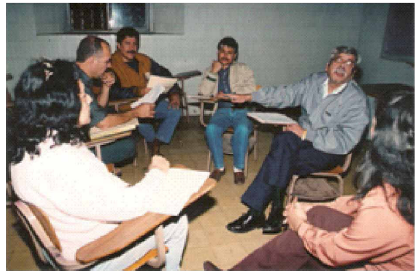
Los maestros de la institución fortalecen el espíritu académico a través de las reuniones de academia.

En tal sentido, uno de los fines de la Universidad, el desarrollo de la función docente e investigadora, que coadyuva a la transmisión del conocimiento y desarrollo de actividades