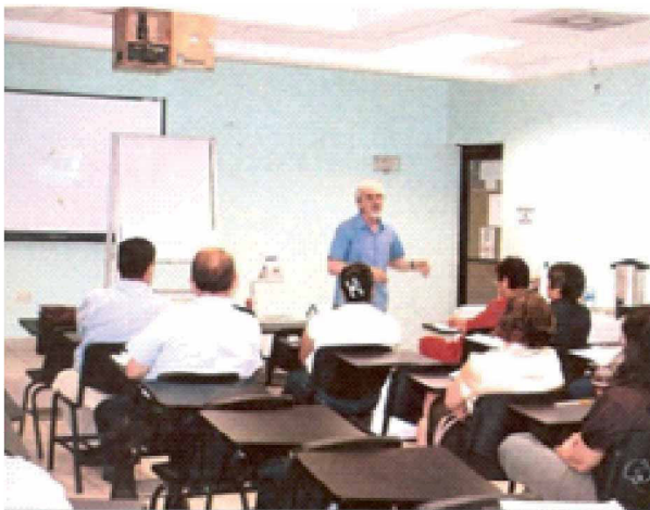
Distintos conferencistas distinguidos han participado en la formación profesional del docente.