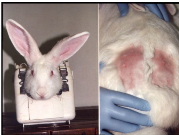
Figura 1. Conejos de la raza New Zealand utilizados en la producción de anticuerpos contra la glicoproteína fusogénica F del paramyxovirus SV5 mediante inmunización con ADN desnudo. Manipulación en cepo de los ejemplares de experimentación. Inoculación intradérmica de ADN, se muestra la zona de inoculación con los puntos en forma de botón.

El cADN codificante para la proteína F está incluido en el plásmido pACCMV.pLpA-F preparado y utilizado para la obtención del adenovirus recombinante, y como control se utilizó el plásmido pACCMV.pLpA que no contiene ningún cADN insertado. Cada plásmido se inoculó en un animal y se obtuvieron sueros de muestras de sangre extraídas por punción en la oreja a intervalos de tiempo intercalados con el calendario de inoculación. En la figura 1 se muestra uno de los animales utilizados en este ensayo donde pueden apreciarse los puntos de inoculación en forma de botón durante la administración intradérmica de ADN plasmídico.