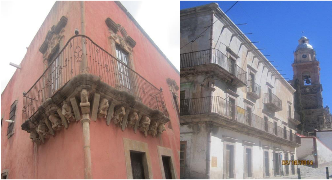
Casa de Petra Puentes y Casa de la Moneda, edificaciones en Real de Catorce que aún muestran su belleza original Fotos: Laura I. Charles Lara, febrero de 2014

La arquitectura en ruinas convertida en un paisaje, la entendemos como una mezcla de signos valorados, descifrados y aceptados por los individuos que los admiran. Las experiencias vitales de nuestra vida cotidiana tienen lugar en un paisaje, transcurre en el marco de una geografía donde múltiples atmósferas, ya sea vivida o imaginada, son un mosaico de colores, un espacio único con sensaciones y emociones, con un universo de historias personales y colectivas (Castellanos, 2014, p. 11). Un catorceño nos indica orgulloso el origen sobre la arquitectura de su pueblo: “La arquitectura es colonial en tiempo de los españoles, lo que sí, por ejemplo, como había mucha gente, entonces construyó muchas casas. Se nota la bonanza” (Entrevista 4 cita: 10).