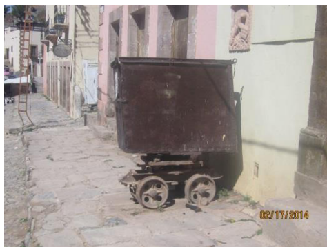
En la foto se muestra uno de los carros de minero, adornando una calle de Real de Catorce, pues representa su pasado económico.

Los primeros descubrimientos de los yacimientos en Catorce no se pudieron explotar por múltiples dificultades, como lo peligroso del terreno, sierra agreste, además de contar con un clima frío. Pero también reinaba el desorden en la explotación como en la administración y los trabajadores. Los empresarios mineros estaban expuestos a extorsiones por parte de los jueces además de fuertes pérdidas por la ignorancia de los operarios y sumado a eso, el robo del metal (la plata), aunque se dieron eventos que les permitió a los exploradores lograr su hazaña. Carlos III, reconoció el Cuerpo de Minería de Nueva España en la Real Cédula del 1 de julio de 1776. Y seis meses después, a principios de 1777 el Virrey Bucareli dispuso la creación del