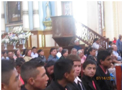
Jóvenes en su graduación de secundaria en Real de Catorce (2014), entre ellos un joven suizo.

El estado actual de Real de Catorce, y en virtud de esa diversidad con la que ahora cuenta, se concibe como un pueblo interconectado con el resto del mundo; en opinión de Touraine (2006) y en sintonía con la condición de este municipio lleno de vida después de caer casi en el olvido, este autor asevera que ya no existen culturas que estén verdaderamente aisladas, ya que el mundo está en perpetuo movimiento (Touraine, 2006, p. 190). Esto lo observamos en Real de Catorce, donde encontramos gente que convive en este espacio, llegados desde todas partes del mundo.