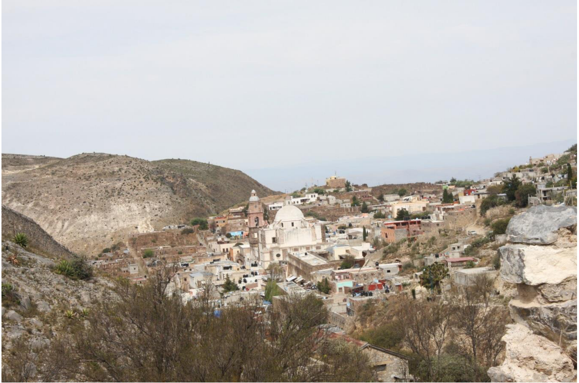
Panorámica de Real de Catorce, S. L. P., época actual.