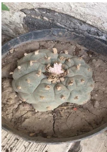
Peyote, cactácea del norte de México.