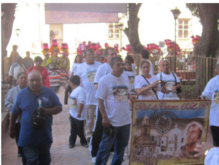
Peregrinos entrando a la Iglesia de la Purísima Concepción en Real de Catorce, el día 4 de octubre de 2013.

La fecha de su celebración es tan importante que los días del 3 al 5 de octubre el pueblo se ve abarrotado de turismo, y por lo tanto, no es posible recibir más automóviles –de hecho es la única fecha del año que cierran la entrada al pueblo-, lo confirma el jefe de turismo del pueblo, además, la mayoría de sus calles están llenas de comerciantes ambulantes y peregrinos, y resulta difícil transitar en el pueblo. 29