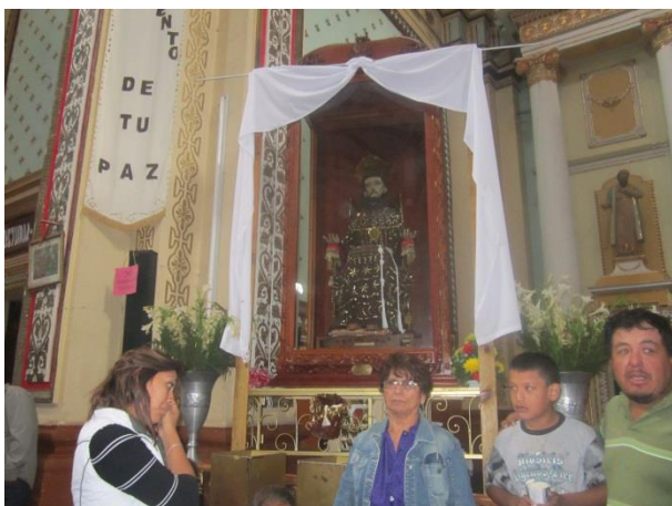
Peregrinos visiblemente emocionados ante la imagen de San Francisco de Asís, en la Iglesia de Real de Catorce. Abril de 2015

Durkheim (2007) aseveraba que todo ser humano se entiende a partir de la sociedad a la que pertenece, en ese sentido, la sociedad puede ser entendida como un ente abstracto que influye sobre los individuos que la conforman. En algunas sociedades, el papel que juega su dimensión moral es de tal magnitud que provoca la espiritualidad en los individuos al hacerles concebir una sensación de lo divino. Por lo tanto, considero que, tomada en su conjunto, la sociedad impone maneras de pensar y de actuar, ya que en el fondo éstas son prácticas elaboradas por todos sus sujetos, en este caso podríamos agregar el pensamiento religioso. 27