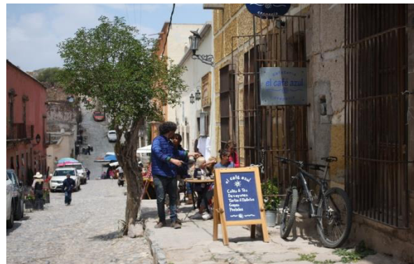
Extranjeros paseando por el pueblo, además se puede observar las antiguas casas convertidas en restaurantes.

Por lo que se ha investigado, y según teóricos como Beck (1998) y Touraine (2006), se da un movimiento a escala mundial que surge a partir de los años ochenta. Esto coincide con lo