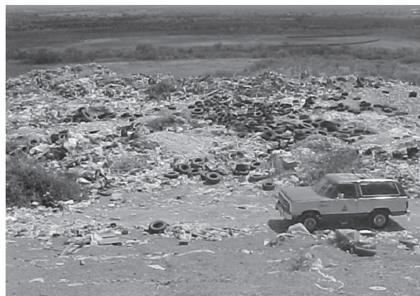
Fig. 1. Tiradero municipal.

industrial (figura 1). Los residuos fueron depositados en un lomerío en contacto directo con el macizo rocoso, compuesto por lutitas de la Formación Méndez del Cretácico superior, es una estructura geológica de tipo braquianticlinal bifurcado; carece de una geomembrana que los aisle del contacto con las aguas subterráneas.