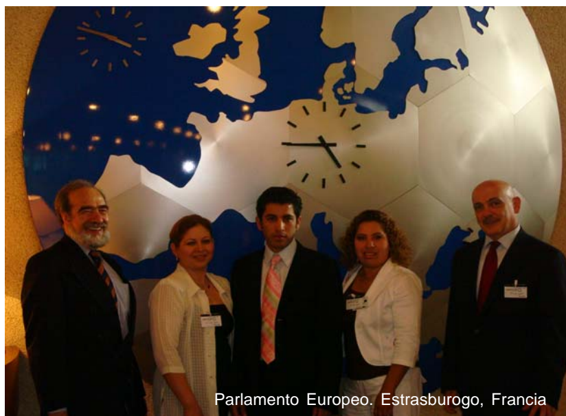
Parlamento Europeo. Estrasburgo, Francia

Muñoz Ledo, del Centro Latinoamericano de la Globalidad; diputado Cuauhtémoc Sandoval, secretario de la comisión de Relaciones Exteriores de la Cámara de Diputados, y Fernando Margáin, ex-senador y actual alcalde del municipio de San Pedro, Nuevo León.