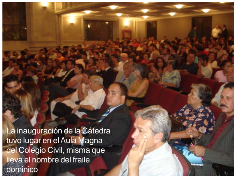
La inauguración de la Cátedra tuvo lugar en el Aula Magna del Colegio Civil, misma que lleva el nombre del fraile dominico

“Si algo hay en Mier es vida parlamentaria, ese ideal de que la vida de un país, de una nación, es una cosa que se discute en asamblea... y es así que, quienes tenemos una visión liberal y democrática de la vida pública pues tenemos en fray Servando una fuente de lectura, de sabiduría, de una conversación con el doctor Mier, de la cual esta cátedra será un capítulo muy rico”.