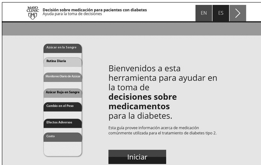
Figura 1. Herramienta elección de medicamento para diabetes (versión online).

suradas, y en encuentros donde no se les da la posibilidad de expresar sus preferencias, contexto ni experiencia de enfermedad 18 .