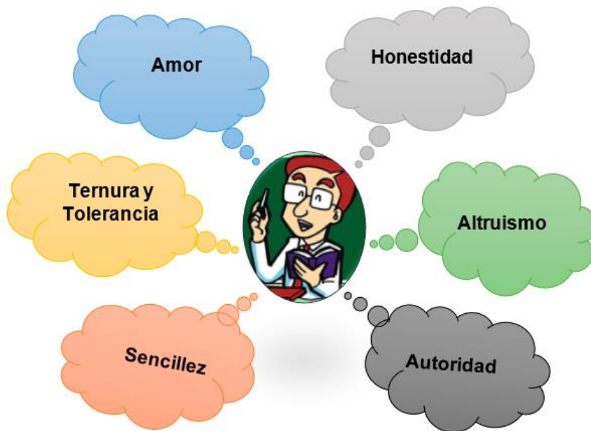
Figura 2. Axiología del docente con liderazgo.