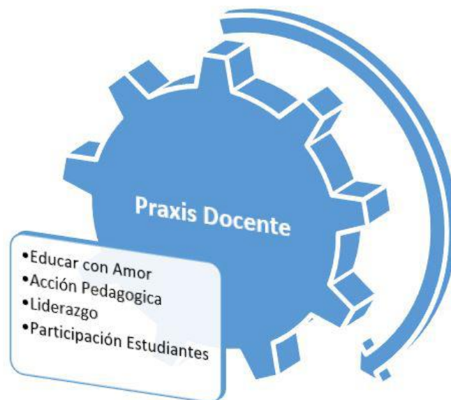
Figura 3. Praxis del Docente desde el amor.

Considerando lo anterior, los docentes desde la orientación de una visión amplia de las realidades sociales, políticas, educativas, familiares de cada estudiante es un contexto único que se debe comprender desde acción pedagógica y holística de convivencia en un clima escolar alternativo e innovador, que propicie el surgimiento de la creatividad y esperanza en cada uno, en un proceso de autovaloración como seres humanos en fonación como buenos ciudadanos, de acuerdo con la figura 3.