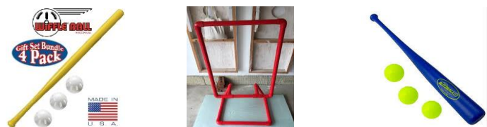
Equipo necesario para jugar wiffle ball

No hay cátcher, so se usa una zona de strike cuadrada atrás de home donde la pelota que sea lanzada por el pitcher debe pegar para ser contada como strike si el bateador no hace swing o la falla. No existe la base por bolas, solamente hay base por golpe, es a 3 outs por entrada, se juega a 4 entradas, para poner out a un corredor de tercera al home plate es necesario lanzar la pelota y que golpee la base de la zona de strike y que llegue antes que el corredor pise el plato para decretarlo como out, debe haber por los menos un juez.