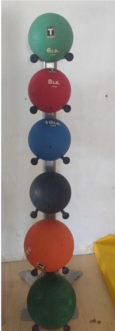
5. Pelotas Medicinales hasta de 6 lbs hasta 16 lbs.