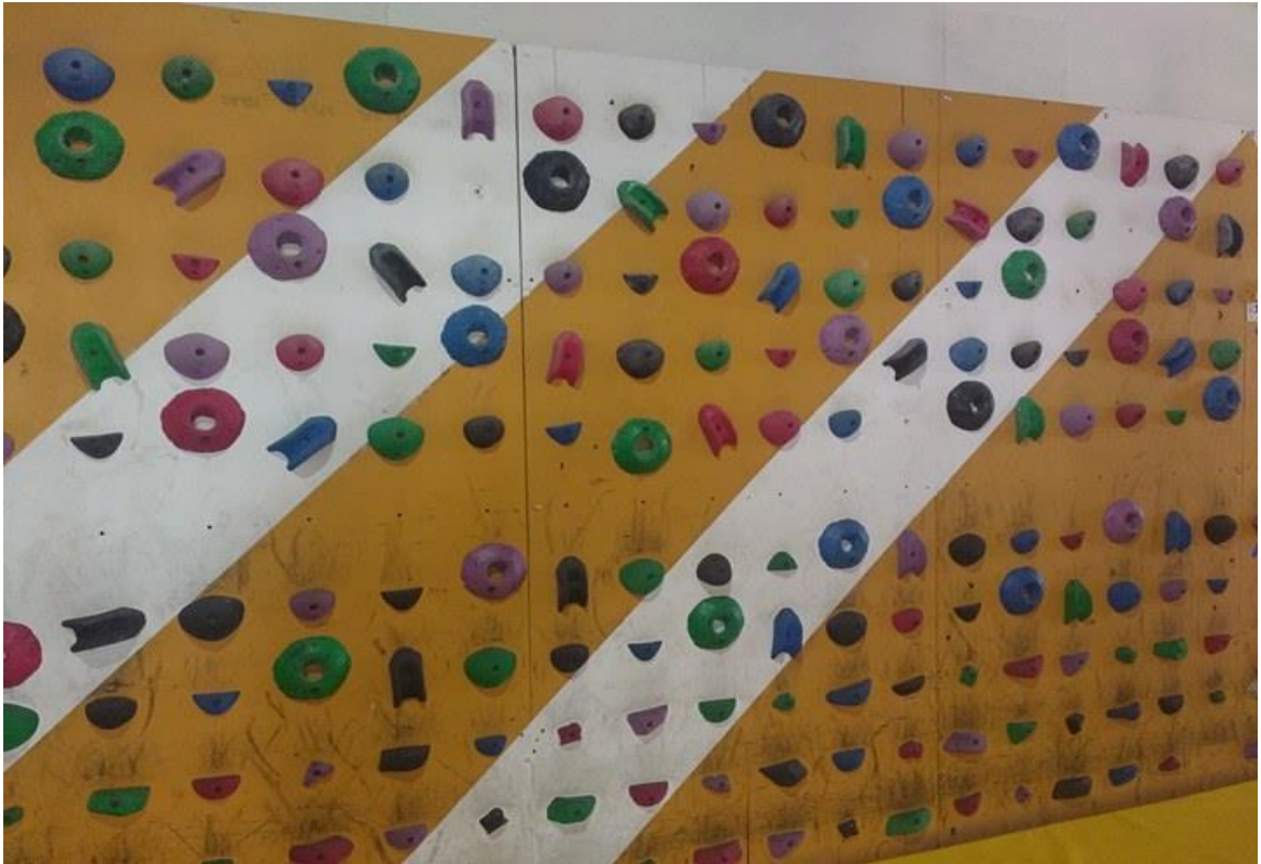
4. Muro Pedagogico