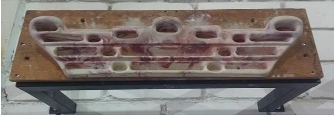
3. Hand Board