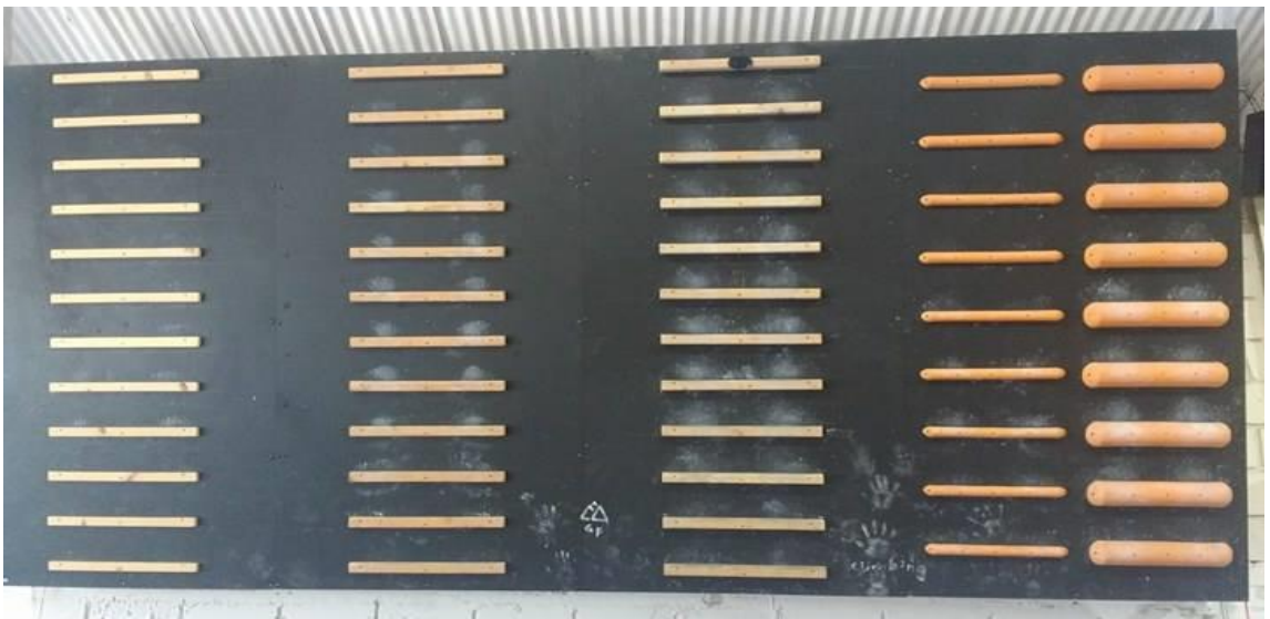
2. Campus Board