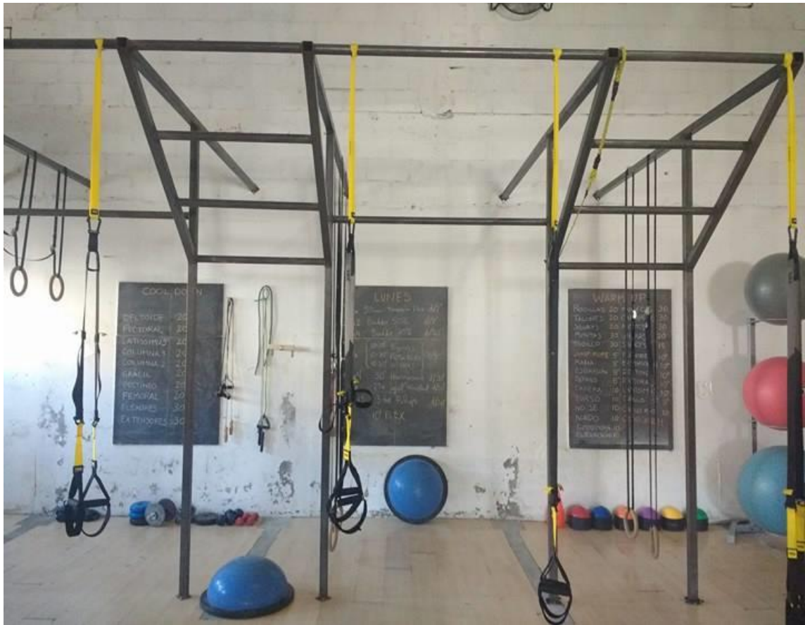
6. TRX System, Sistema de Entrenamiento en suspensión.