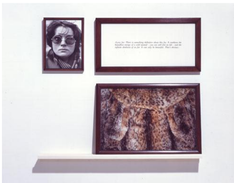
Figura 1. De Sophie Calle. “Les Aveglues” (1986) (Parte de instalación)

La reducción, ocultación, desmaterialización y la desaparición se podrían utilizar para la observación de la negación de lo visual en instalaciones de obras visuales, en la instalación de Sophie Calle toca la ceguera fuera de la metáfora, para la visualidad su contrario se delinea en la reducción, ocultación, desmaterialización y la desaparición, pero para la ceguera en la instalación de Sophie Calle no oculta sino que muestra, materializa y aparece lo que está oculto para lo visual y latente en sus contexto de la ceguera.