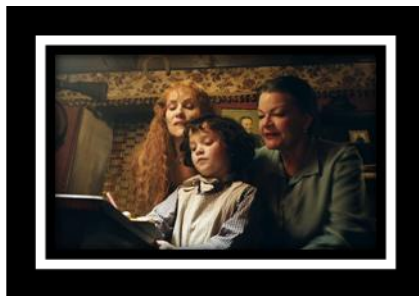
Figura 8. "La momie" (2007)

Algunos efectos o más bien defectos de la visión no dependen solamente del órgano ocular sino su relación con la función cerebral. La teleopsia por ejemplo, no es considerada ceguera, es considerada más bien como trastorno cerebral de la visión, con esta deficiencia se hace parecer a la vista que las imágenes retroceden, esto es un defecto neurológico reflejado en el sistema visual que en el cine es utilizado para crear cierta sensación emocional en el espectador, el llamado "efecto Hitchcock" que utilizó en sus películas, una de ellas la película "Vértigo" (1958) precisamente evocando el miedo a las alturas. Otra película que ha utilizado este efecto es: Poltergeist (1982) dirigida por Tobe Hooper aquí aparece una escena en la que hace parecer que el final del pasillo se aleja cada vez más.