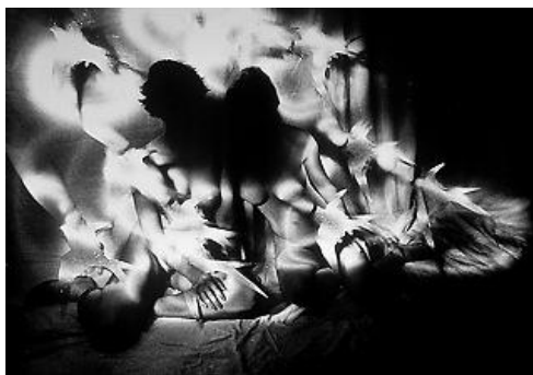
Figura 7. de Evgen Bavcar “Desnudo a dos y golondrinas”

Evgen Bavcar (16), fotógrafo ciego, no considera la fotografía como parte de la realidad, en cada fotografía demuestra claramente no intentar apegarse a la fidelidad de las líneas y formas pues en su caso su obra la considera más como una estructura conceptual tal vez por esta razón se encuentra más cercano a un fotógrafo como Man Ray uno de los tantos surrealistas en los que se puede analizar a través de la ausencia de forma, la categoría que permite deconstruir categorías, lo informe. Como Bataille menciona: La producción de imágenes que no decoran sino que estructuran los mecanismos fundamentales del pensamiento. (17)