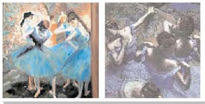
Figura 4. de Edgar Degas. "Bailarinas en azul" (1890) "Bailarinas en azul" (1897)

Cuando existen anomalías en la visión de los colores es debido a la deficiencia de los conos contenidos en mayor cantidad en la mácula. El pintor Degas comenzó a presentar la enfermedad visual de manera progresiva a partir de sus 36 años de edad, que deterioró su visión central y afectó la percepción del color. Requirió de la ayuda de un asistente para la identificación de los colores de su paleta pues lo que él consideraba "pasteles" en realidad eran colores intensos (13)