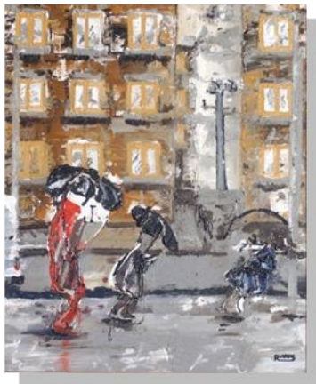
Figura 6. de Rafael Arias Fernández “Lluvia en la ciudad” (1997)

Evgen Bavcar (16), fotógrafo ciego, no considera la fotografía como parte de la realidad, en cada fotografía demuestra claramente no intentar apegarse a la fidelidad de las líneas y formas pues en su caso su obra la considera más como una estructura conceptual tal vez por esta razón se encuentra más cercano a un fotógrafo como Man Ray uno de los tantos surrealistas en los que se puede analizar a través de la ausencia de forma, la categoría que permite deconstruir categorías, lo informe. Como Bataille menciona: La producción de imágenes que no decoran sino que estructuran los mecanismos fundamentales del pensamiento. (17)