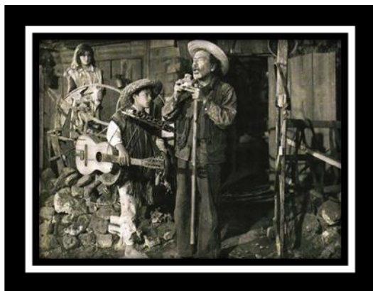
Figura 11. "Los olvidados" (1950)