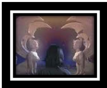
Figura 12. “The NeverEnding Story” (1984)

En “The Never Ending Story” de 1984 dirigida por Wolfgang Petersen aparecen los oráculos sin mirada como portadores de información y hablan con gran sabiduría en el sentido en el que aparece en “Ojos abatidos: La denigración de la visión en el pensamiento francés del siglo XX” de Martin Jay” ...el hecho de que los griegos a menudo representaran a sus visionarios como ciegos (Tiresias por ejemplo) e hicieron que sus oráculos pronunciaran predicciones verbales más que visuales” [Jay 2008 p28]. (33) Sin dejar de lado la ceguera sabia en el personaje de “Mama Oddie” dentro de la película animada “The princess and the frog” (2010) de Walt Disney.