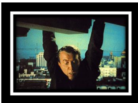
Figura 9. "Vértigo" (1958)

Algunos efectos o más bien defectos de la visión no dependen solamente del órgano ocular sino su relación con la función cerebral. La teleopsia por ejemplo, no es considerada ceguera, es considerada más bien como trastorno cerebral de la visión, con esta deficiencia se hace parecer a la vista que las imágenes retroceden, esto es un defecto neurológico reflejado en el sistema visual que en el cine es utilizado para crear cierta sensación emocional en el espectador, el llamado "efecto Hitchcock" que utilizó en sus películas, una de ellas la película "Vértigo" (1958) precisamente evocando el miedo a las alturas. Otra película que ha utilizado este efecto es: Poltergeist (1982) dirigida por Tobe Hooper aquí aparece una escena en la que hace parecer que el final del pasillo se aleja cada vez más.