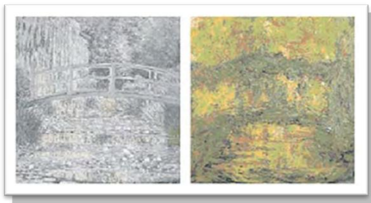
Figura 2 de Claude Monet. “Le Bassin aux Nymphéas” (1899) “Le Pont japonais” (1923)

Se tiene documentado que la afección de cataratas fue adquirida por Claude Monet dejándose entreabierto la posibilidad de pensarse que esto hubiera influido en algún momento en la técnica de su obra, que fue considerada como enlace hacia los movimientos que continuaron, especialmente el expresionismo abstracto. Como característica dentro de su obra y que se va acentuando es la distorsión del color y la imagen, va desapareciendo el detalle, los contornos son imprecisos, los blancos se vuelven amarillos, los azules y violetas acaban por desaparecer convirtiéndose en rojos y amarillos. El padecimiento de cataratas es una de las afecciones más comunes, sus causas pueden ser tanto por enfermedades como la diabetes o por cuestiones hereditarias; tabaquismo, o ya sea envejecimiento. En las cataratas la parte que no logra una función óptima es la del cristalino, éste se nubla es decir va perdiendo la transparencia sin dejar pasar luz necesaria para el registro visual (En: Arqué M. L. 2005)