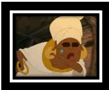
Figura 13. “The princess and the frog” (2010)