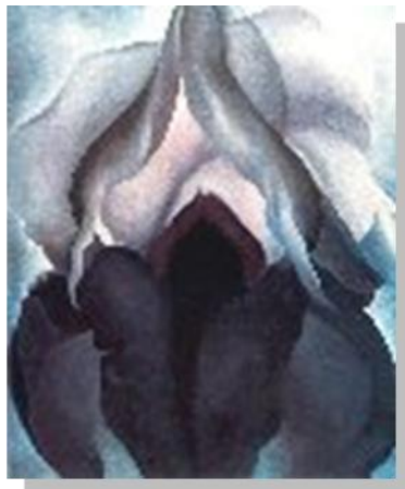
Figura 3. de Georgina O'Keeffe. "Iris negro" (1926)

donde se recibe la luz que se enfoca con la córnea y el cristalino, cuando es afectada la mácula se deteriora el centro de los objetos que son observados pero se sigue percibiendo la visión periférica.