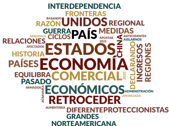
Figura 7. Escenario Neoproteccionista