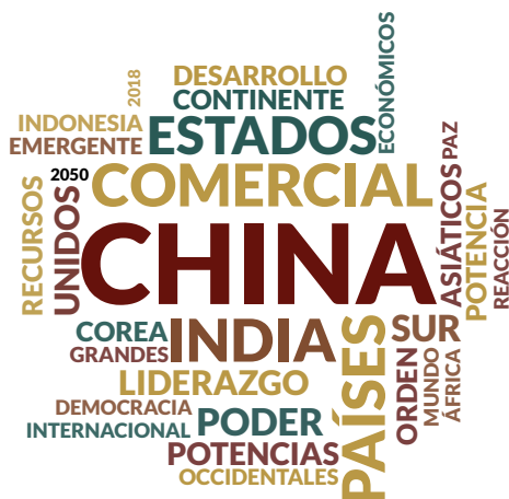
Figura 4. Escenario Liderazgo de Asia Pacifico