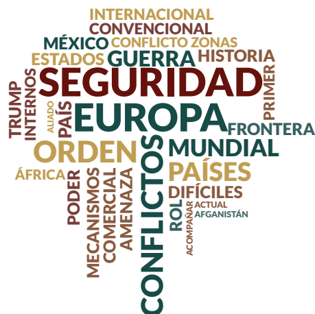
Figura 6. Escenario Amenaza a la Seguridad