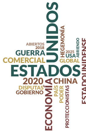
Figura 5. Escenario Unipolar