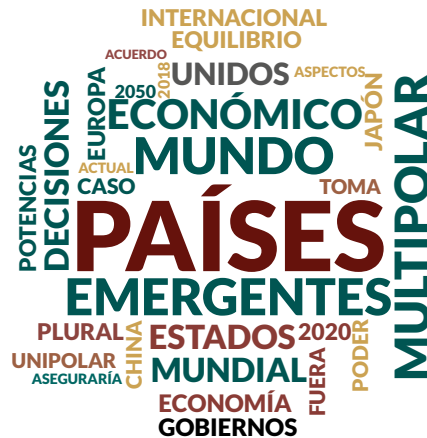
Figura 3. Escenario multipolar