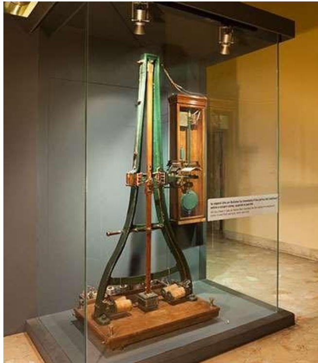
Figura 1. Pantelegráfo

La palabra televisión es un híbrido que fusiona dos conceptos: uno griego “tele”, que significa distancia y otro, de origen latino, que alude al término visión. La historia del desarrollo de la televisión ha sido, esencialmente, una continua búsqueda de un dispositivo adecuado para explorar imágenes. En sus orígenes, la televisión se fue constituyendo como una técnica manual de transmisión de imágenes, que utilizaba el espacio como medio de propagación.