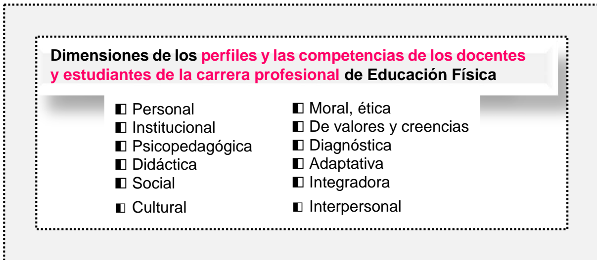
Figura 1. Dimensiones de los perfiles y las competencias de los docentes y estudiantes de la carrera profesional de Educación Física.

A continuación, se presenta la Figura 1, que integra las dimensiones de los perfiles y competencias de los profesores y estudiantes de la carrera profesional de Educación Física, y posteriormente se describen los aspectos que forman parte de las mismas.