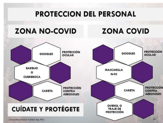
Figura 1. Equipo de protección personal (EPP) para los profesionales de la salud.

La imagen muestra una infografía para ser colocada en las áreas COVID y No-COVID a nivel hospitalaria enfocada a los trabajadores de la salud por el Dr. Alfredo Covarrubias-Gómez con información de (Lavianno, Koverech, & Zanetti, 2020).