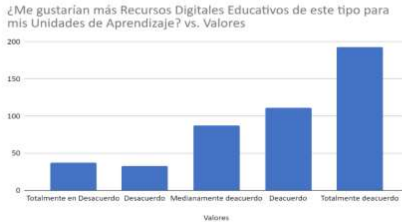
Figura 3. Preferencias de uso de recursos educativos

Un indicador es el grado de aceptación de los recursos educativos digitales (REEDI) por los alumnos, para lo cual se aplicaron encuestas sobre la utilización de estos. En la figura 3 se observa que los alumnos tienen mayor preferencia hacia el uso de este tipo de recursos.