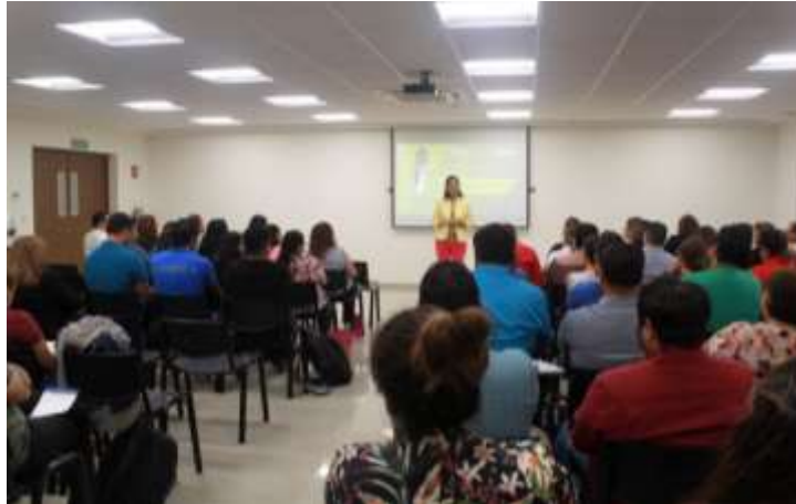
Figura 1. Reunión informativa del proyecto de rediseño instruccional del bachillerato general en línea

Para la integración de actividades en línea a las UA, particularmente el desarrollo de recursos educativos digitales con enfoques basados en la metodología del Design Thinking , y generación de ideas y soluciones orientadas al usuario, se estableció un proceso sistemático dentro de un marco de creatividad e innovación desarrollado en los últimos años en la DED. Es un modelo de elaboración propia adaptado del modelo ADDIE (Chevalier, 2011), el cual permite la incorporación de tendencias de innovación educativa aplicables al desarrollo de recursos digitales.