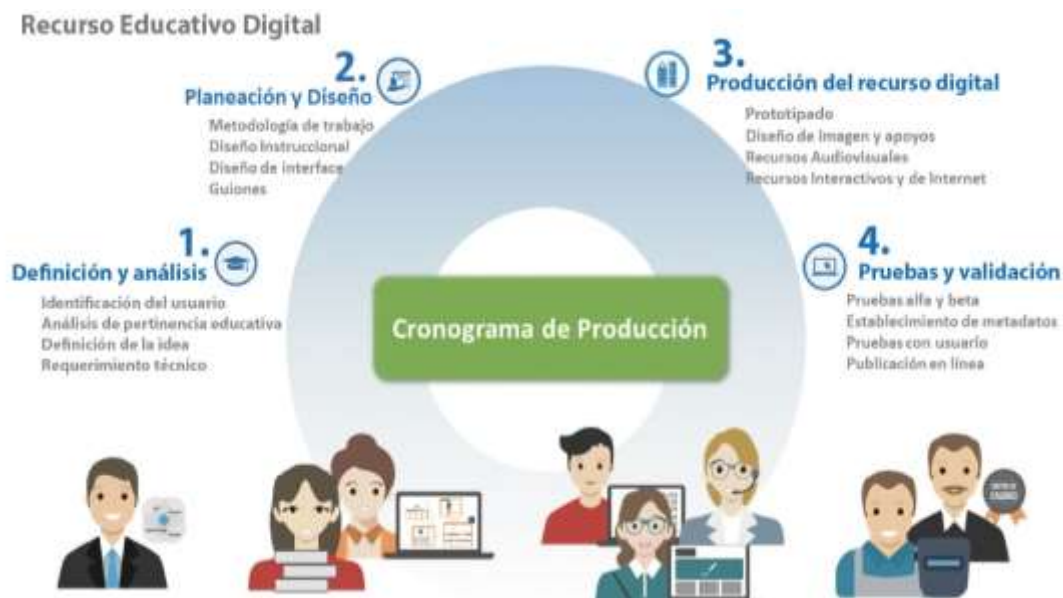
Figura 2. Proceso de desarrollo de recursos educativos digitales

Como resultado de este trabajo en conjunto, se logró el rediseño instruccional y producción de recursos educativos digitales para las 36 UA que conforman el nuevo mapa curricular del Bachillerato General en modalidad no escolarizada y mixta, conforme a lineamientos metodológicos, didácticos y tecnológicos establecidos para dicha modalidad educativa.