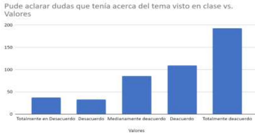
Figura 5. Recursos como reforzador para aclarar dudas en clase