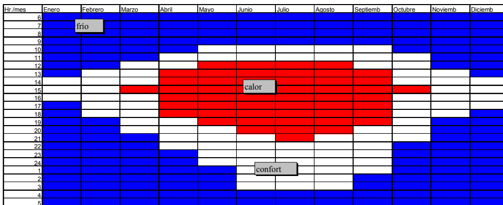
Fig. 2. Gráfica Givoni para Monterrev. N.L. México

El resultado del equilibrio térmico fue de 8090.66W/hr requeridos para obtener el confort en el espacio. En el AMM son 6 (Tabla 2. Gráfica Givoni para Monterrey, N.L., México) meses los de verano y de acuerdo al monitoreo realizado al inmueble se requieren 13hrs. para mantener el confort. Teniendo por consiguiente el número de horas al año: 2340, las cuales multiplicadas por los 8090.66 W es igual a 18932144.4 Watts requeridos al año. Esta cantidad de energía como se comento en un principio tiene un costo, el cual se obtiene multiplicando por la tarifa de kw/h, lo que nos da una anualidad que será reflejada durante la vida útil del inmueble. El gasto representado en los flujos anuales a valor presente se disminuye al valor comercial, ya que por tener un diseño adecuado el inmueble se demerita.