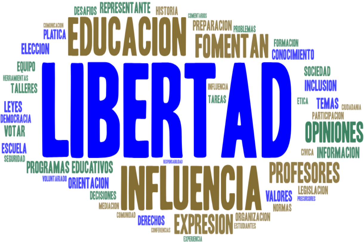
Figura 6. Marca de nube de las palabras más frecuentes mencionadas por los pre-ciudadanos

clase o en su caso amigos, finalmente maestros. Teniendo en cuenta que los alumnos comentan sobre la relevancia que tuvo para ellos materias como historia, formación cívica, ecología y la relación que tienen con su formación como ciudadanos, así como la libertad que sienten al expresarse dentro de la escuela. Partiendo de las percepciones que presenta Villamor (2023) destaca que la educación se entiende como un espacio mediante el cual los aprendizajes y enseñanzas no tienen fin, los espacios escolares son abiertos y no fijados, determinando una experiencia pura.