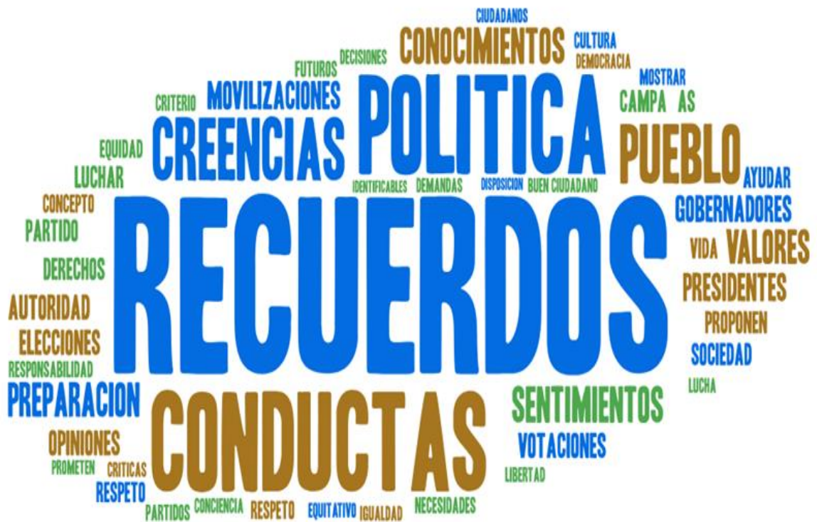
Figura 1. Marca nube de las palabras más frecuentes mencionadas por los pre-ciudadanos sobre sus nociones de Cultura política

Se descubrió que los pre-ciudadanos, son conscientes de que es una democracia, así mismo cómo se aplica y se construye, desde su perspectiva se basa por ciudadanos y para los ciudadanos poniendo como centro al pueblo, comunidad o ciudadanía, teniendo en cuenta que el poder es otorgado por el pueblo a los gobernantes. Como sustento Dewey (1995), plantea que la participación activa de los ciudadanos en la vida política es determinante pero solo se puede dar mediante la participación y toma de decisiones, conocer y reconocer que la democracia no es un sistema estático.