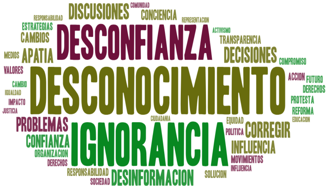
Figura 9 Marca de las palabras frecuentemente mencionadas por los pre-ciudadanos

No me informo y porque los políticos desinforman. Preparatoria No. 3 (G4)