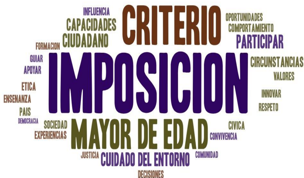
Figura 2. Marca de nube de las palabras más frecuentes mencionadas por los pre-ciudadanos

Los valores hay que tenerlos para ser un buen ciudadano hay que tener en cuenta el propósito que tenemos como parte de la sociedad, de saber respetar, cumplir las normas, poder aportar a la sociedad, y no tener problemas no, infringir leyes causar problemas, es comportarnos como es esperado.