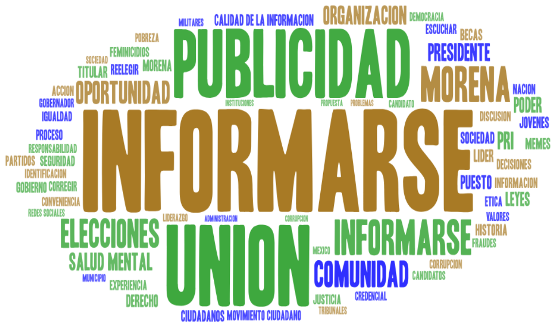
Figura 4. Marca nube de las palabras más frecuentes mencionadas por los pre-ciudadanos sobre el interés político.

No soy mucho de opinar de ese tema, principalmente, no me considero con los conocimientos suficientes para opinar, pero siento que si hay algunas cosas que halagan a las personas que se eligen para gobernar.