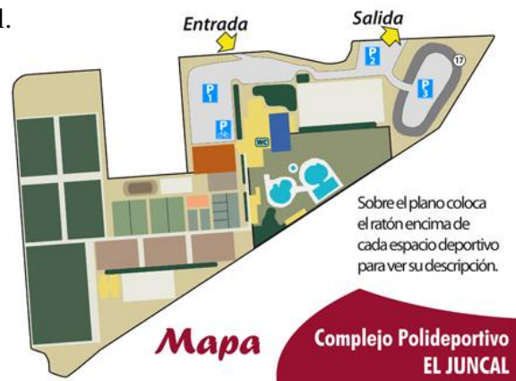
Figura 3. Plano del Complejo Polideportivo el Juncal (Ciudad Deportiva Municipal , 2012).