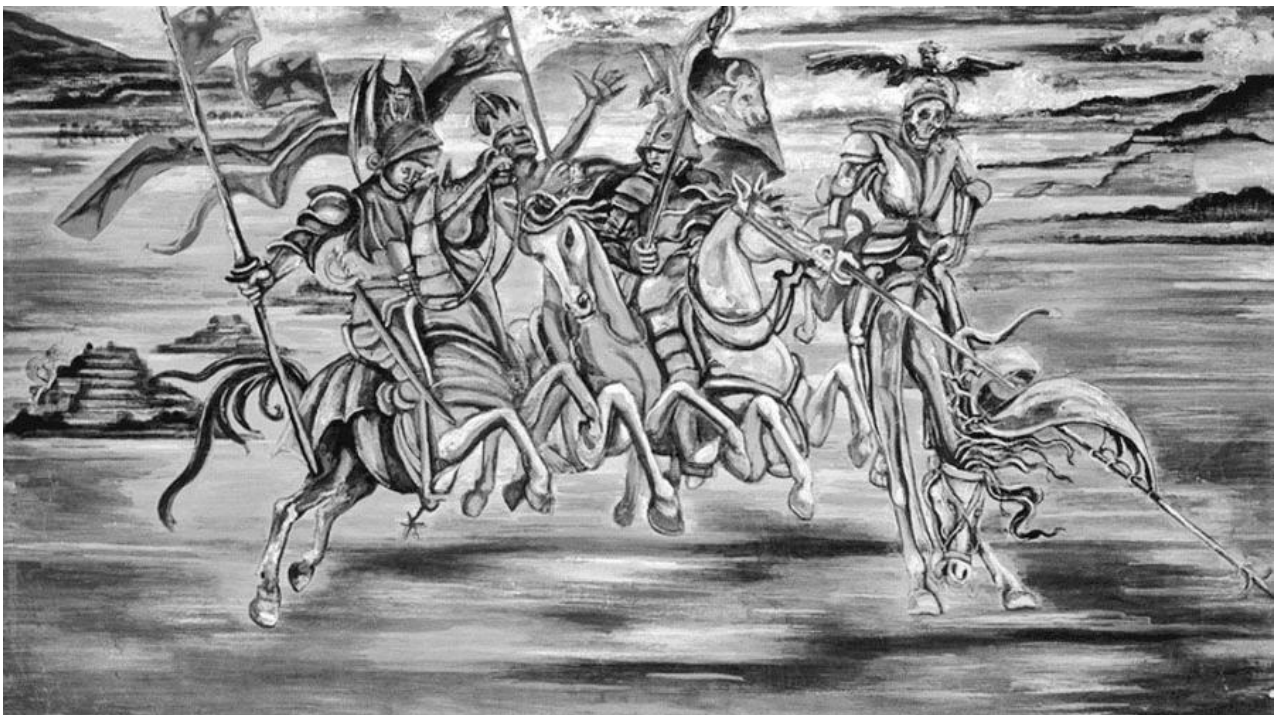
Los Cuatro Jinetes del Apocalipsis

Otra de las obras representativas de la historia cultural y además muy leída, es la del historiador italiano Carlo Ginzburg (1981), El queso y los gusanos. El cosmos según un molinero del siglo XVI , de 1976. Este libro de marcada inspiración antropológica, por lo cual se le podría bautizar de historia antropológica, versa sobre la apropiación muy particular que se hizo un molinero (conocido como Menocchio) sobre la personalidad de Cristo y la religión católica. La trama que desarrolla Ginzburg, es la forma en que un personaje –perteneciente a lo que él llama cultura popular-, a partir de su lectura solitaria de Dante y la Biblia, se representa cosas diferentes a las que dicta la cultura oficial, en este caso la Iglesia. Dicha situación lo llevará a ser interrogado por el Santo Oficio, proceso que generará una serie de discrepancias entre las preguntas de los jueces y las respuestas de Menocchio acerca de la inmortalidad del alma, la mundanidad del cuerpo y