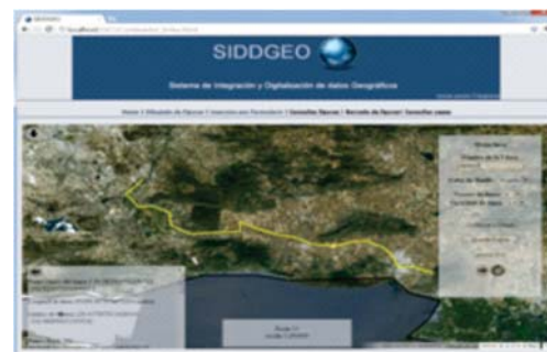
Fig. 2. Edición de polilíneas describiendo trayectorias y superficies.

Asimismo, se pueden conformar polígonos con los operadores del sistema, los cuales determinan la superficie del polígono generado y describen detalladamente la posición coordenada en relación a la imagen de base, la cual también nos permite evaluar