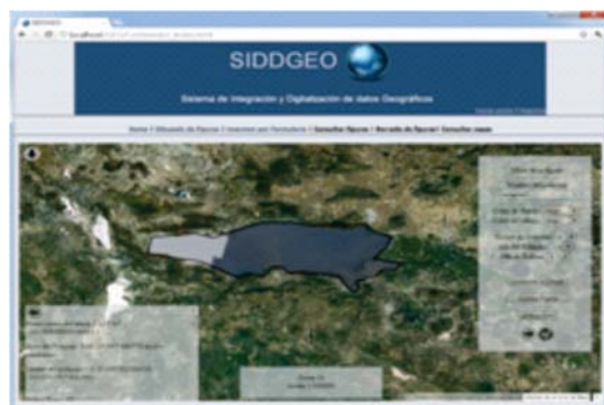
Fig. 3. Edición de polilíneas describiendo superficies a través de polígonos cerrados.

una relación de su correspondencia, tanto geométrica como topológica, según la escala de edición del elemento. (figura 3).