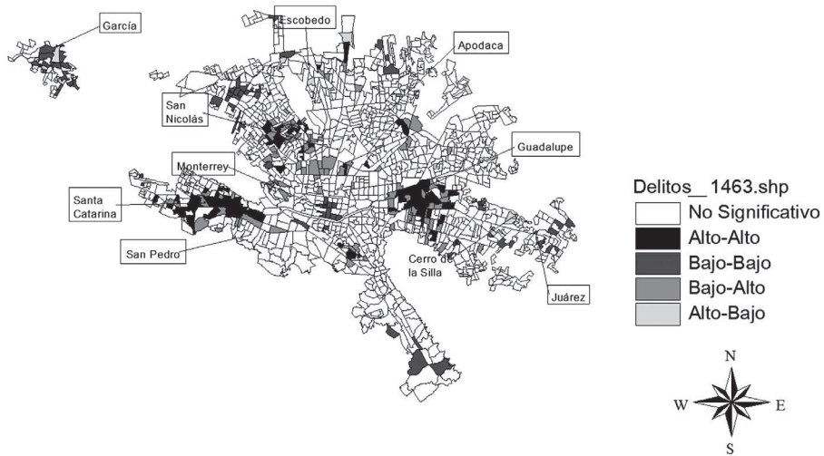
Autocorrelación Espacial Local Presuntos Delincuentes No Violentos por cada mil habitantes, AMM