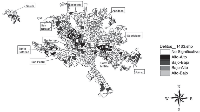
Autocorrelación Espacial Local Presuntos Delincuentes Violentos por cada mil habitantes, AMM