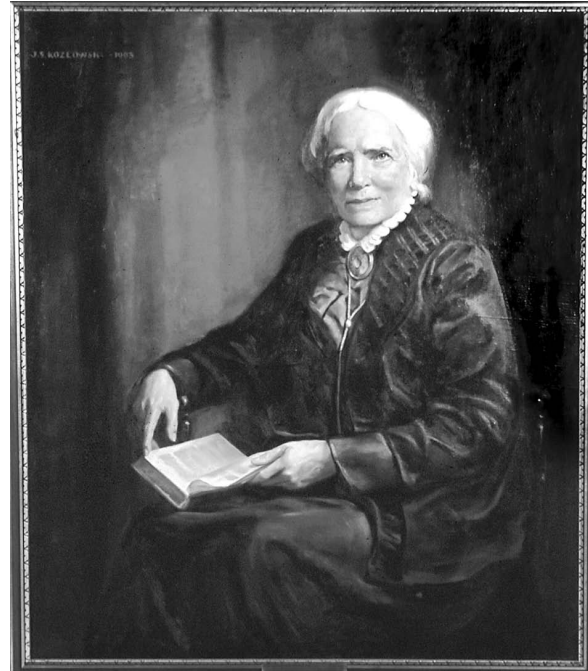
Figura 2. Elizabeth Blackwell, 1963, retrato de Joseph Stanley Kozlowski.

Nombró a la doctora Rachel Cole, primera mujer afroamericana que se graduó de medicina en Estados Unidos, como su compañera en la dirección del establecimiento. 3