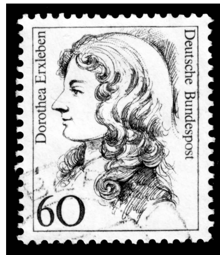
Figura 1. Dorothea Christiane Erxleben. Sello germano de 1987, “Serie de Mujeres en la historia alemana”.

sometida por tener expectativas diferentes. Con inapreciable léxico, arguye la habilidad filosófica y científica; señala que el conocimiento está distribuido equitativamente entre géneros, pero que la mitad de la humanidad no tiene acceso a la buena educación para desarrollarse.* Usa su conocimiento filosófico, teológico y científico para describir dos milenios de misoginia de los líderes de la Iglesia, filósofos y hombres de ley.