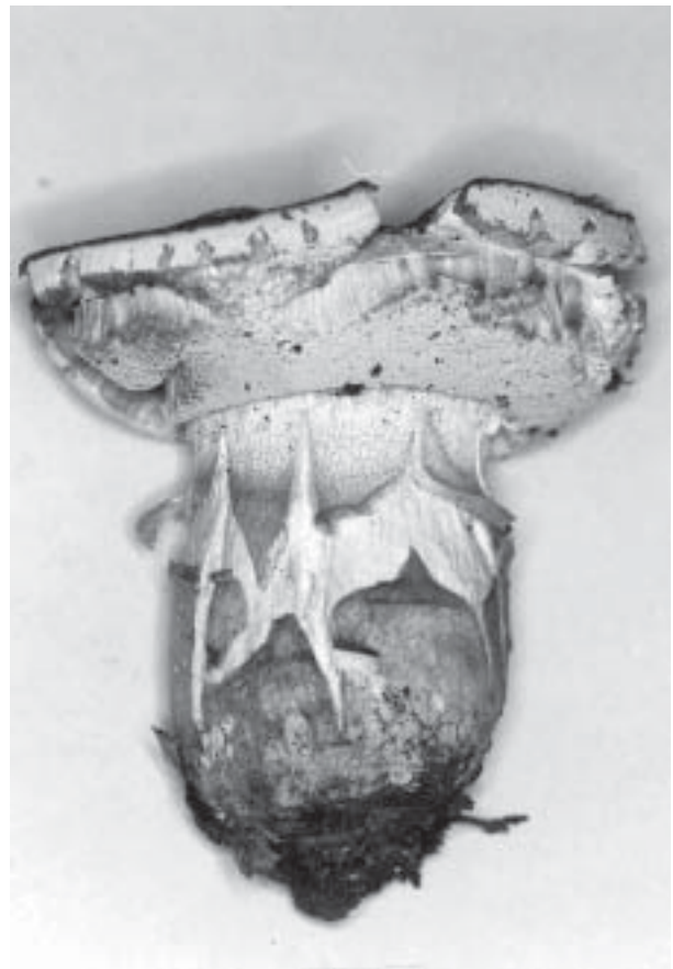
Boletus variipes .

México presenta un alto nivel de biodiversidad vegetal y en ella se encuentran ampliamente distribuidos los bosques ectotróficos, que a su vez albergan una alta diversidad de especies de hongos de la familia Boletaceae. Existe una alta correlación entre la diversidad vegetal de estos bosques ectotróficos y la de especies de hongos de esta familia que ha resultado de la coevolución de la simbiosis micorrizógena. En este estudio se reconoce a México como un centro de alta diversidad fúngica de la familia Boletaceae dada la presencia de la mayor parte de los géneros de Boletaceae reconocidos en el mundo. Los géneros mejor representados en esta investigación son Boletus con 63 especies, seguido por Suillus con 28 y los otros géneros tienen una canti-