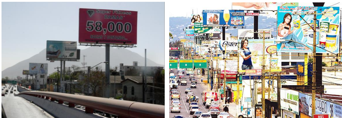
Fig. 1-2. Ejemplos de contaminación visual.

Examinemos un poco el cuerpo ultrajado de la ciudad mexicana. Las calles y avenidas que son simbólicamente venas y arterias, nos revelan dos usos no considerados por la planificación funcional, la terrible agresión a cualquiera que ose caminar cerca de raudales de coches que son cápsulas de vértigo donde aflora lo peor de cada individuo por la posesión territorial de lo efímero, mientras el recorrido contiene tantas y tan variadas imágenes multiplicandose en cada horizonte descubierto con la mayor cantidad de publicidad posible, como si la meta fuera llenar cada hueco de lo visible con todo el catálogo de servicios de lo existente.