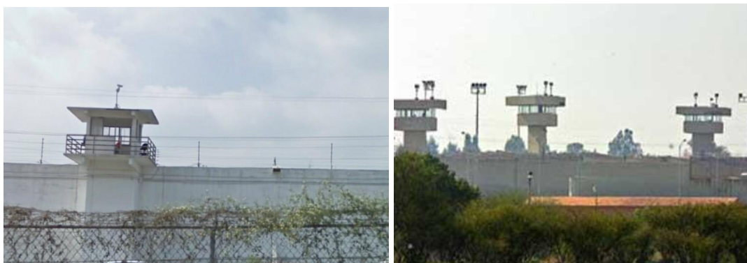
Figs. 8-9. Vistas de centros penitenciarios.

Al igual que en las reglas del capital comercial, un gran sector de esa vivienda que no se puede pagar y exige un output del sistema a través del desalojo y la ocupación efímera por medio de inquilinos (los llamados aviadores o posesionarios), en el mundo penitenciario con la fuga constante de reos da una muestra elocuente de una seguridad de papel, es decir, de una cultura donde el cumplimiento de la contemplación formal y el límite a través de los muros y torres de vigilancia no secunda la obsesión funcional: una cadena informal de desalojo y reocupación llena de intersticios y vacíos. Cada uno de ellos normados y regulados por tramas de significación espontánea.