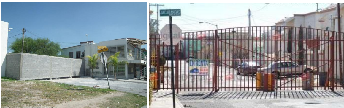
Figs. 6-7. Ejemplos de nuevos blindajes residenciales improvisados.

De esta inseguridad y temor se extrae un factor funcional que a la inversa del uso de suelo previsto para la circulación, aquí se basa en la explotación totalmente previsible de una veta para el gran capital comercial. La publicidad inmobiliaria coloca en primer plano todo lo que tenga que ver con amurallamiento, vigilancia o corte de flujos de circulación ante un consumidor desesperado.