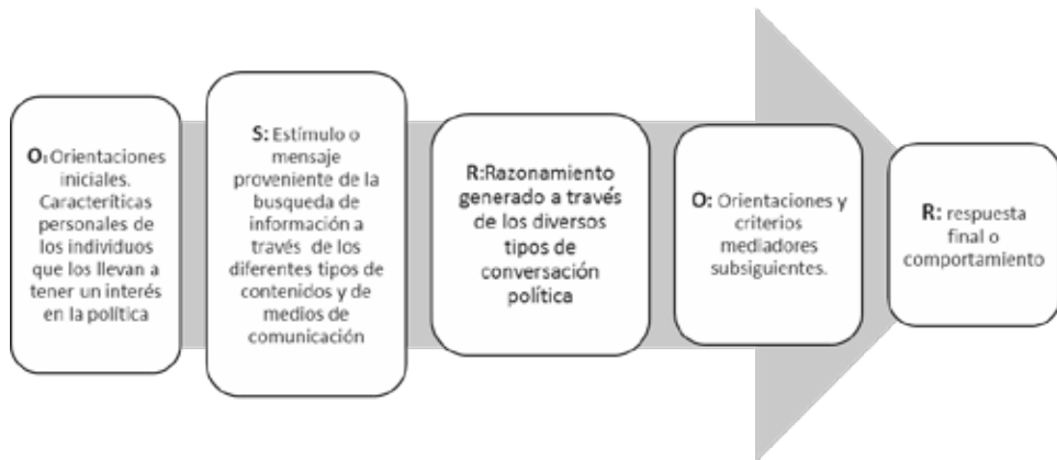
Figura 1. Modelo de Mediación Comunicativa en Campaña o-S-R-O-R

A partir de estos hallazgos, se ha planteado posteriormente el modelo o-S-R-O-R, 37 que propone la incorporación al Modelo de Mediación Comunicativa 38 del razonamiento (R), esto es, el proceso individual de raciocinio generado por la influencia de la conversación (re) política cara a cara, y de la red, a fin de generar el Modelo de Mediación Comunicativa en Campaña (ver figura 1). La importancia del modelo radica en la capacidad de analizar, desde varias aristas, la influencia de los medios de comunicación en el comportamiento político de los individuos, en la búsqueda de estabilidad y consolidación de la democracia. Recientes estudios utilizaron el modelo de mediación de la comunicación en el proceso de formación política de los adolescentes. Se encontró que la información recibida a través de los medios de comunicación, la discusión interpersonal tanto cara a cara como la virtual influye en los niveles de compromiso político y refuerza el interés y el conocimiento político. 39 Tomando como referencia la revisión bibliográfica previa, y a partir del Modelo de Mediación Comunicativa en Campaña o-S-R-O-R descrito, se formularon las siguientes hipótesis de investigación: